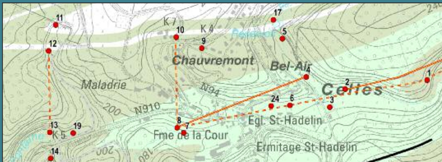
Extrait de l'inventaire au 1/10.000 illustrant les circulations d'eau souterraine au village de Celles (Houyet).

À vol d'oiseau, le parcours de la Lesse entre Houyet et Anseremme se limite à 5 km. Mais les méandres de la rivière doublent cette longueur, comme le constatent les pagayeurs qui la descendent en kayak jusqu'à Walzin. Ceux-ci ignorent peut-être que les massifs rocheux qui jalonnent les versants sont le siège de plus de 300 phénomènes karstiques ! L'œil attentif peut pourtant y « lire » l'incidence de la géologie et de l'érosion de la rivière, qui ont façonné des milieux diversifiés aux intérêts biologique, hydrologique, culturel et touristique.