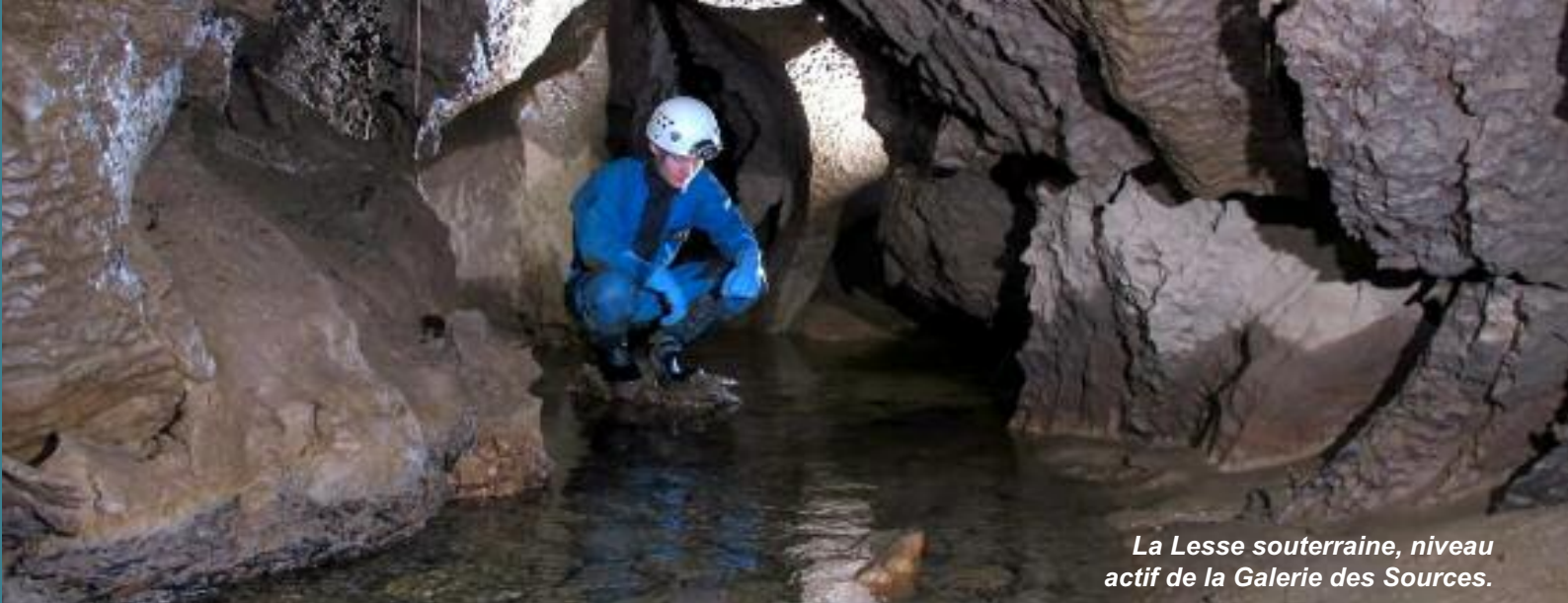
La Lesse souterraine, niveau actif de la Galerie des Sources.