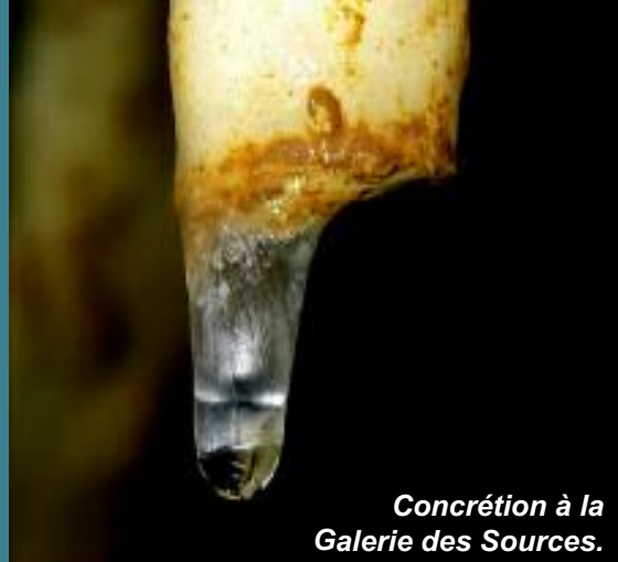
Concrétion à la Galerie des Sources.

Depuis 2009 la Direction des Eaux Souterraines du Service Public de Wallonie a soutenu la publication des monographies karstiques en Haute-Meuse et décidé d'étendre ce travail à d'autres bassins. Leur diffusion doit permettre de faire la lumière sur un milieu souterrain ignoré, mais riche de découvertes.