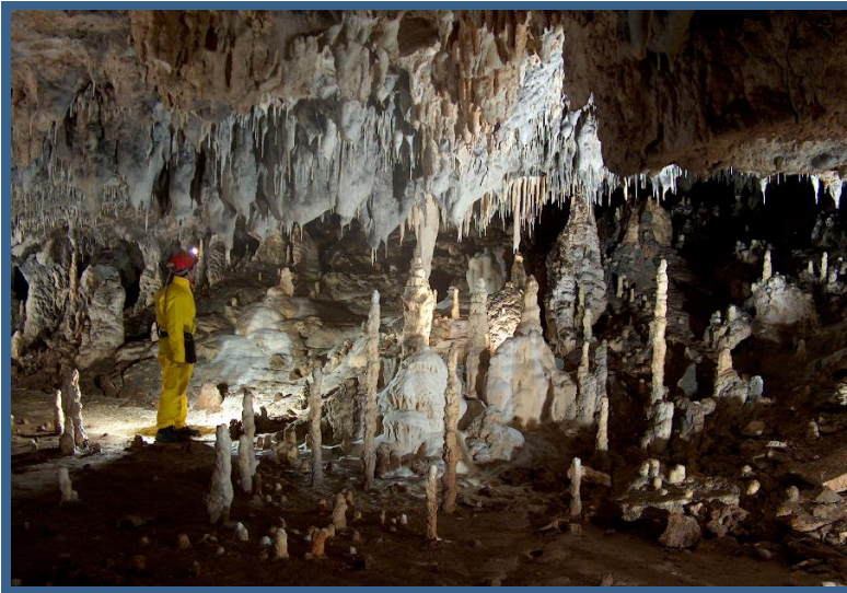
Grotte Snezhanka Montagne Rhodope Bulgarie du Sud